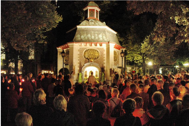
Lichterprozession vor dem Gnadenbild

An der Schwelle der Nacht feiert die Kirche in der Form der Vigil, dass das Licht auch in den Nächten der Menschen leuchtet. An die Vigil schließt sich die Lichterprozession durch die Innenstadt an. Diese endet am Gnadenbild