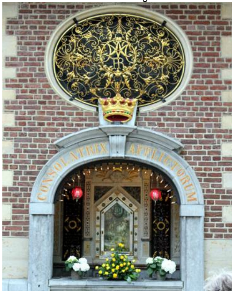
Blick von außen in die Gnadenkapelle auf das Gnadenbild

Die Kirchen und Kapellen sind zum privaten, persönlichen Gebet täglich von 6.30-18.00 Uhr geöffnet. Zu denselben Zeiten ist das Fenster der Gnadenkapelle zum Kapellenplatz hin geöffnet, so dass mit Blick auf das Gnadenbild gebetet werden kann. Im Innern der Gnadenkapelle ist der direkte Zugang zum Gnadenbild vorerst nicht möglich.