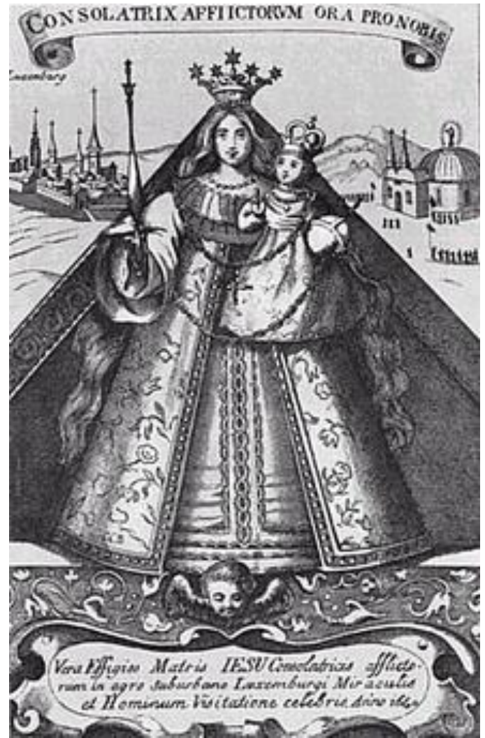
Gnadenbild "Trösterin der Betrübten"