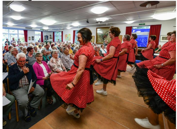
Tanzgruppe der Landfrauen Kevelaer

Mit ihrer Livemusik werden sie mit bekannten Weinliedern und Schlagern die Gäste unterhalten. Eingeladen wird zum Mitsingen, Schunkeln und Tanzen. So wird auch wieder die Tanzgruppe der Landfrauen Kevelaer mit ihren sehenswerten Tanzvorführungen dabei sein.