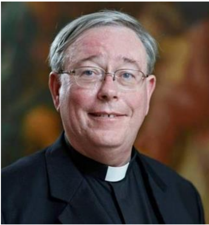
Erzbischof von Luxemburg, S. Exz. Jean-Claude Hollerich