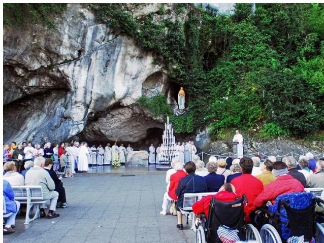
Bild der Lourdeswallfahrt 2018

Die Krankenbruderschaft Rhein-Maas bietet vom 25. Mai - 01. Juni 2019 wieder ihre jährliche Wallfahrt für kranke, behinderte und gesunde Pilger nach Lourdes mit der Bahn an.