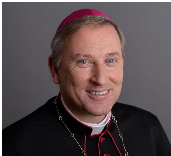
Weihbischof Wilfried Theising

Die geistliche Leitung hat Weihbischof Wilfried Theising.