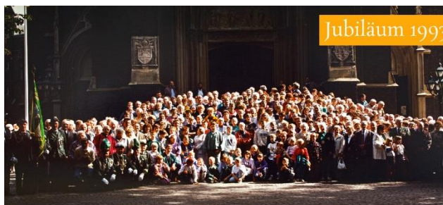
(Gruppenfoto zum 350jährigen Jubiläum)

www.facebook.com/St.IrmgardisWallfahrtRees/