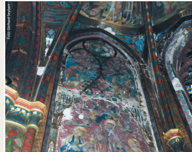
Zum Beispiel: Josefschor, linke Wand: Die hl. Familie