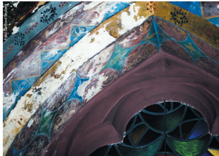
Zum Beispiel: Fensterbogen im Josefschor - Detail