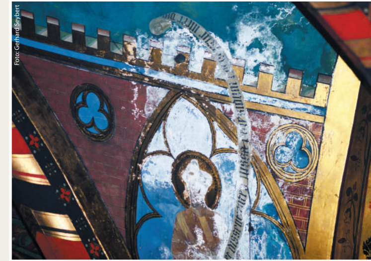
Zum Beispiel: Josefschor, S. Ignatius - Detail