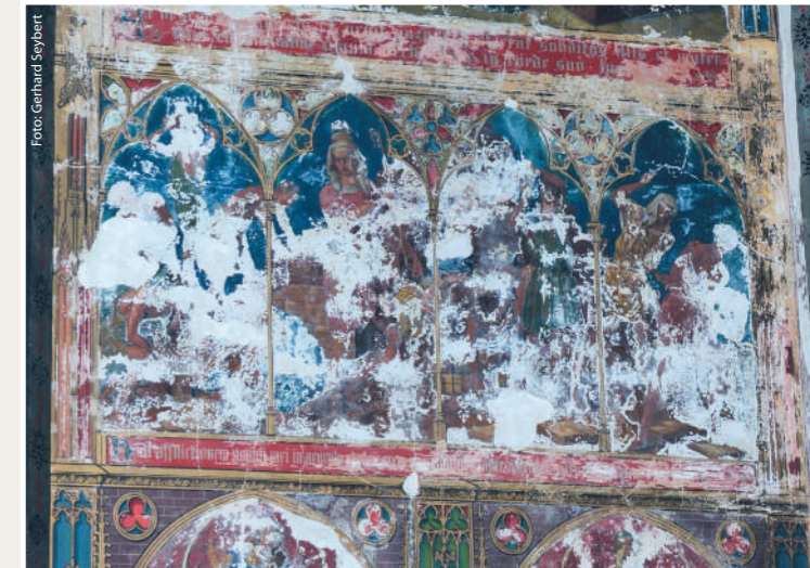
Zum Beispiel: Josefschor, linke Wand: Die hl. Familie bei der Arbeit