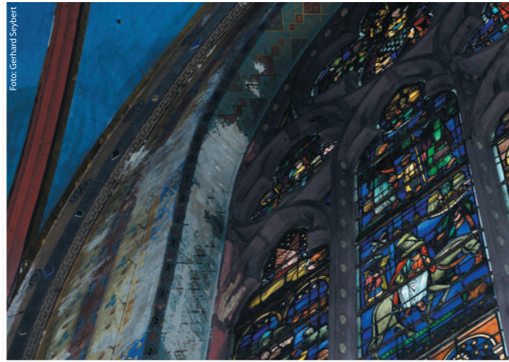
Zum Beispiel: Fenstereinrahmung, Seitenschiff

Pfarrgemeinde St. Marien · Kapellenplatz 35 · 47623 Kevelaer Telefon: 0 28 32 / 9 33 80 · www.wallfahrt-kevelaer.de