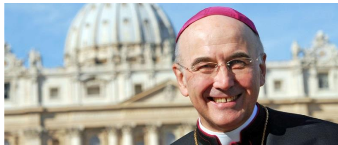
† Dr. Felix Genn Bischof von Münster

Spendentüten werden verteilt und liegen an den Ausgängen aus. Spendenquittungen werden auf Wunsch gerne ausgestellt.