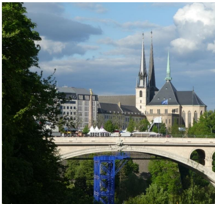
Blick auf die Kathedrale in Luxemburg.

Die Wallfahrt nach Luxemburg findet statt von Samstag 05. Mai bis Montag 07. Mai. 2018. Auf der Hinfahrt besuchen wir Bad Münstereifel. Dieses urige Eifelstädtchen mit der Basilika St. Chrysanthus und Daria lernen wir bei einer Stadtführung näher kennen, anschließend ist Zeit zur freien Verfügung. Dann Weiterfahrt nach Luxemburg zur Glaciskapelle, wo ein kurzes Marienlob gehalten wird. Es folgt die Zimmerbelegung im zentral gelegenen Hotel „Parc Plaza“ und ein gemeinsames Abendessen im Hotel. Am Sonntag ist der feierliche Abschluss der